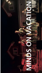
MINDS ON VACATION

Minds on Vacation ist eine Rock/Pop Formation aus dem Botthwartal mit Einflüssen aus Hip Hop und Rock n Roll.