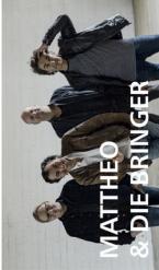
MATTHEO & DIE BRINGER

Mattheo & DIE BRINGER spielen straighten Gitarren-Rock mit einem fein cosierten Schuss Party-Blues und Singer/Songwriter-Momenten. Die Band nimmt das Publikum vom ersten Takt an mit auf eine brettcoole Rock'n'Roll Reise. Die deutschen Texte sind ironisch, nachdenklich, witzig, politisch. Eine lässige Mischung aus eigenen Songs und überraschenden Coverversionen.